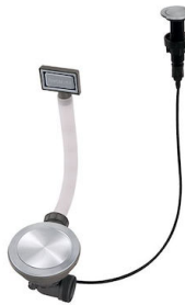
Piletta automatica Space Push - PP 8407 116