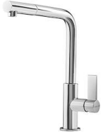
Miscelatore Omega Plus 8497 020