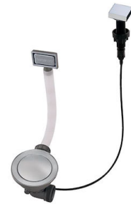
Piletta automatica Space - PA 8407 108